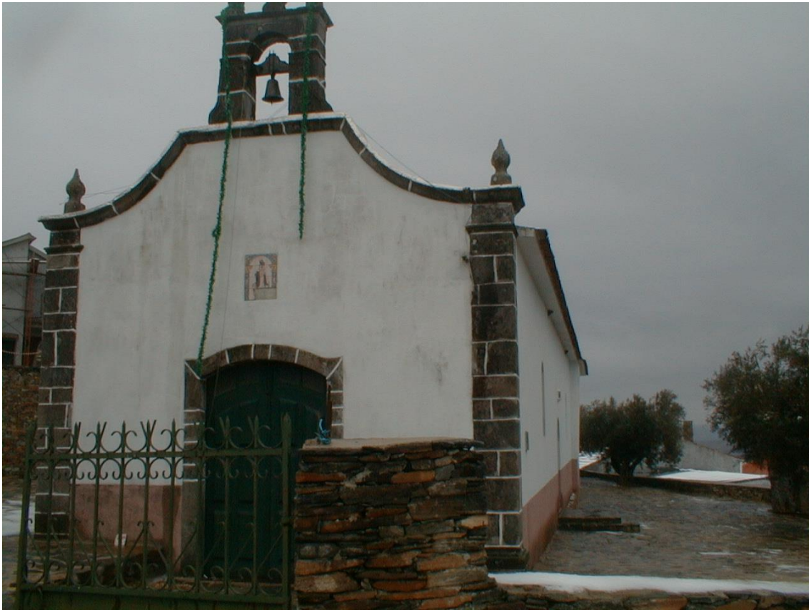
(Capela da NS da Oliveira)