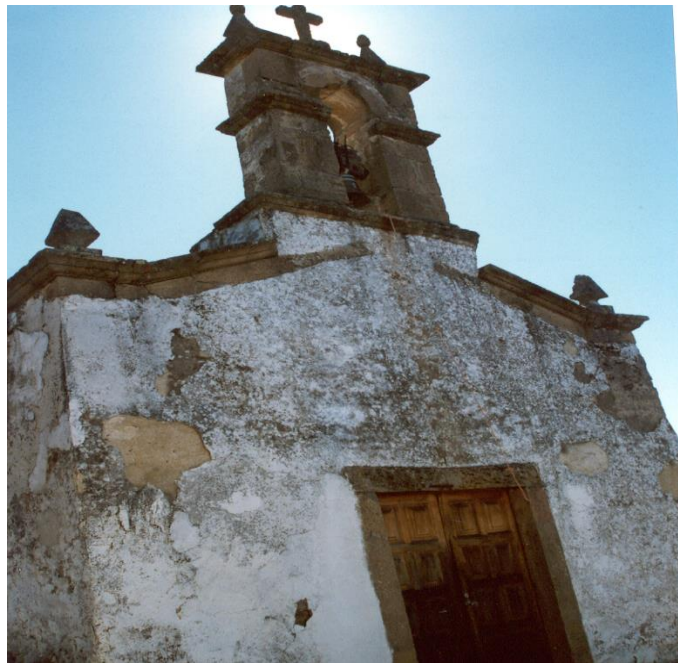
(Igreja Matriz de Paradinha de Besteiros)