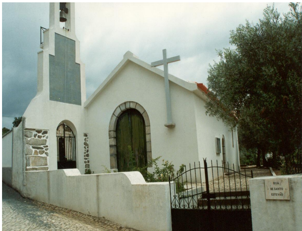
(Igreja – Travanca)