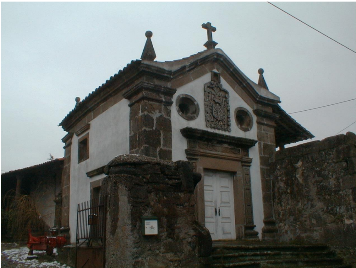
(Capela de Stº António)