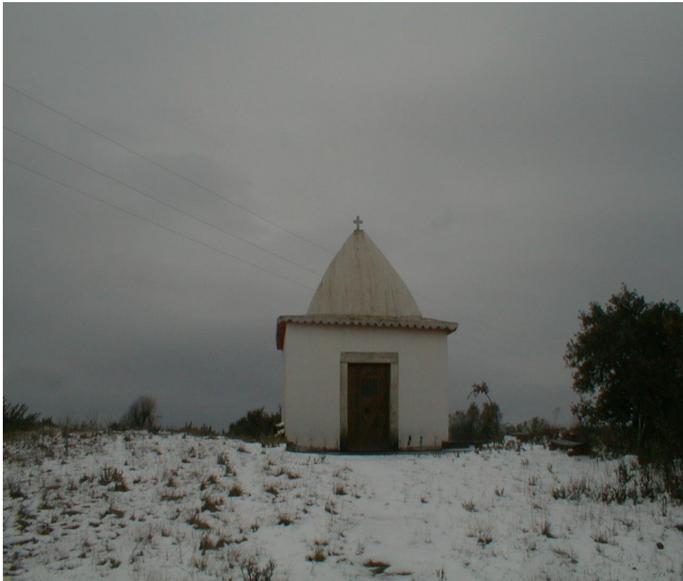
(Capela de S. Pantaleão)