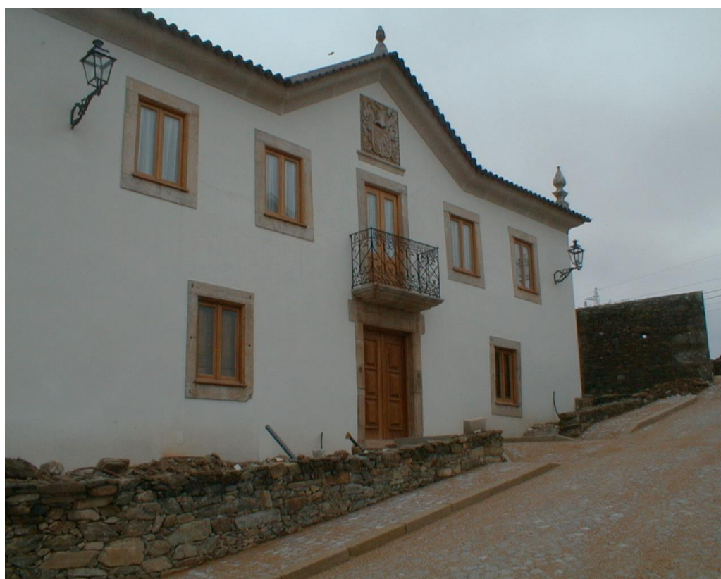
(Solar Moura Pegado)