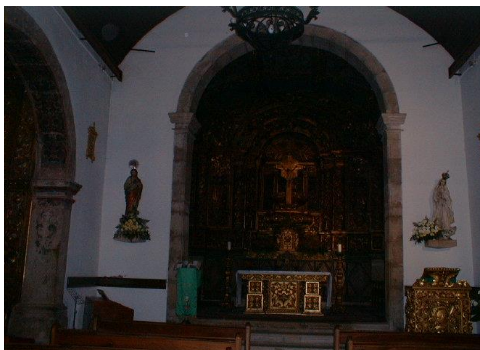
(Altar mor da Igreja Matriz)