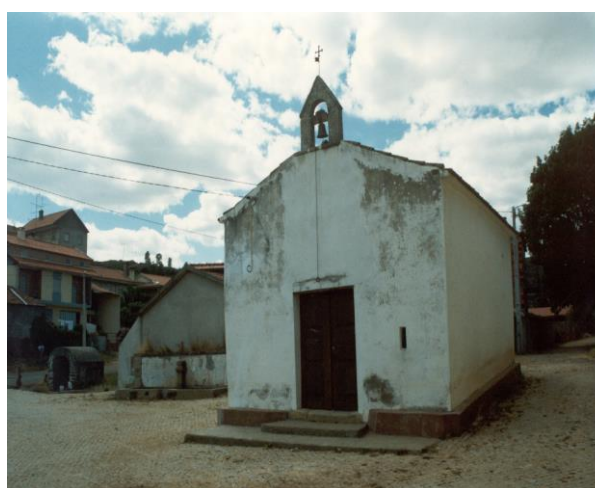
(Capela NS Neves – Olmos)