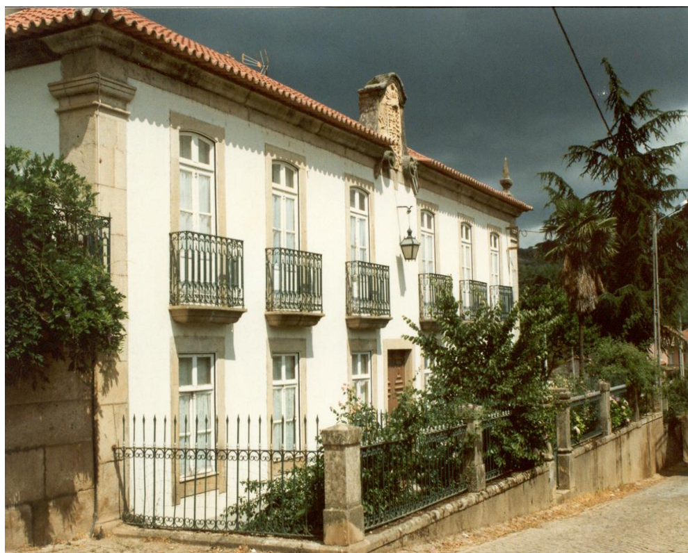
(Solar Sousa Barroso – Travanca)