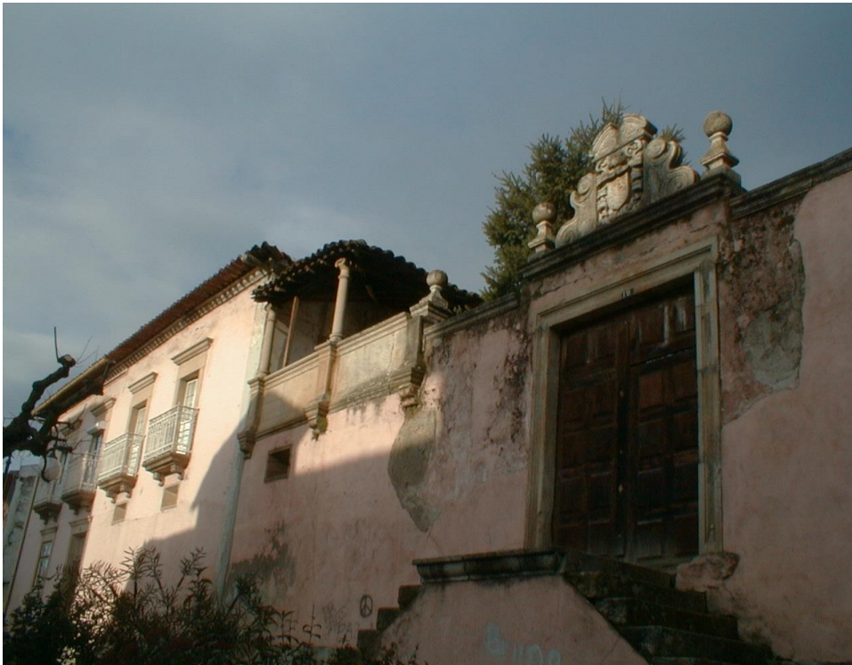
(Solar família Sousa Cardoso)