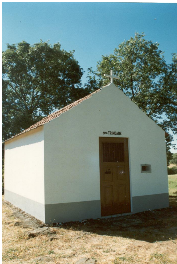
(Capela NS da Trindade – Olmos)