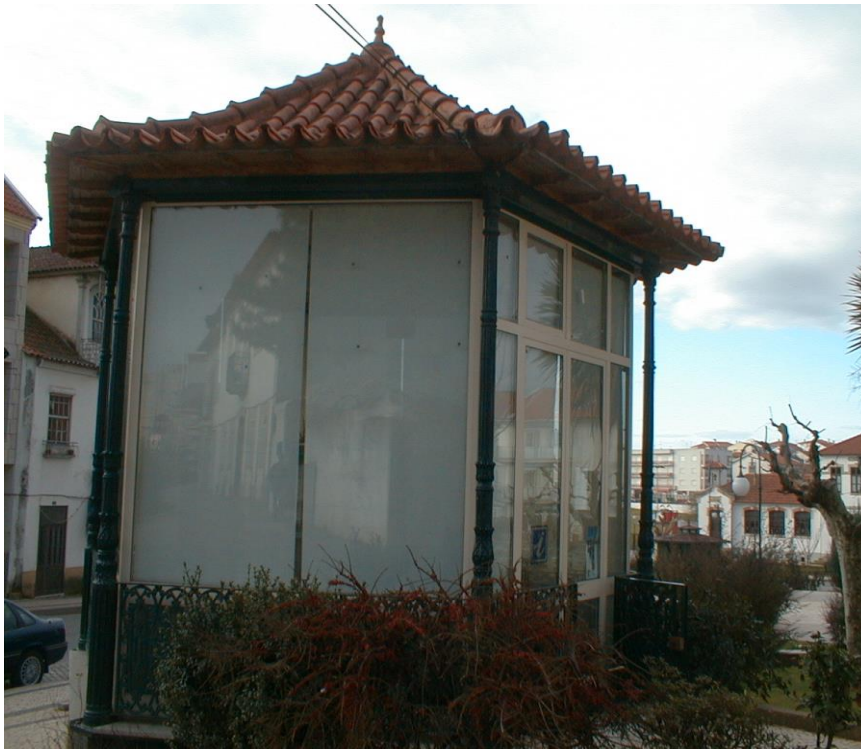
(Posto de Turismo)