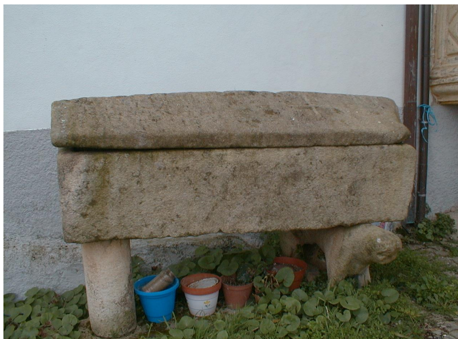
(Sarcófago em pedra com a cruz de Malta)