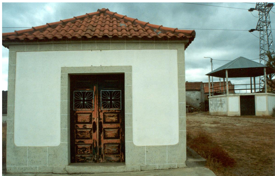
(Capelinha de Santa Bárbara – Travanca)