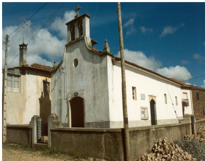
(Igreja Matriz– Nogueirinha)