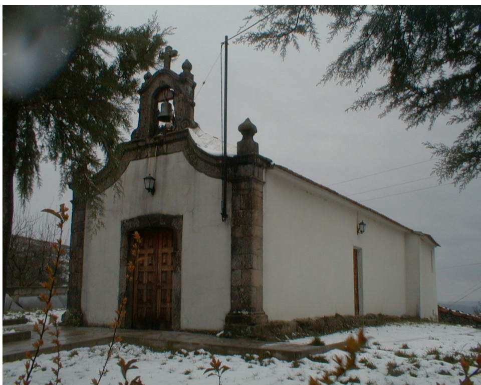
(Capela de S. Sebastião)