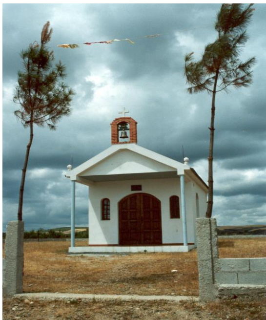
(Capela de Santo António – Murçós)