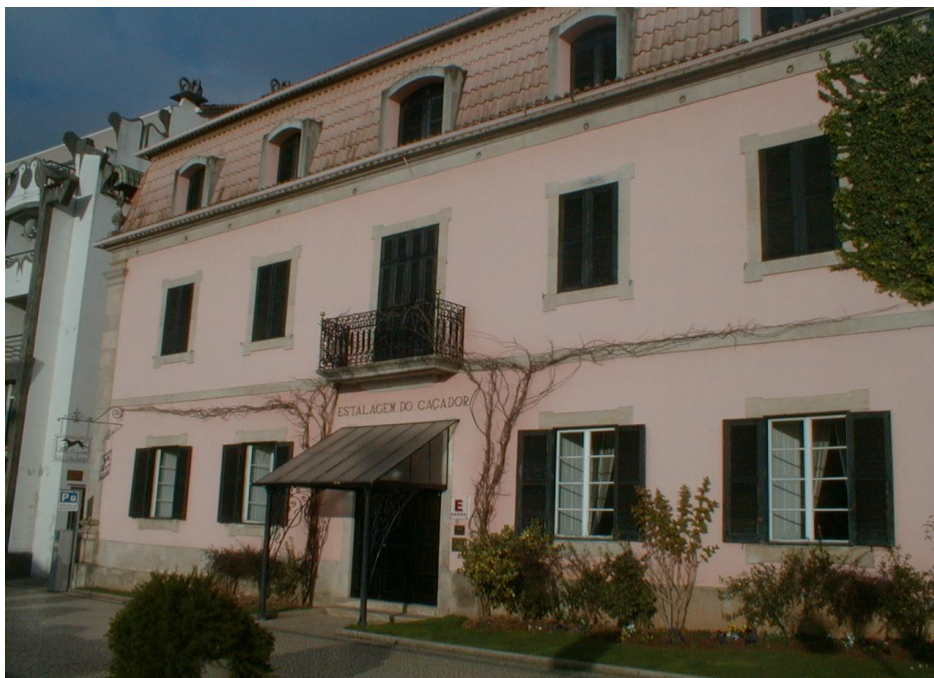
(Estalagem do Caçador – 1ª estalagem de 5 estrelas no nordeste transmontano)