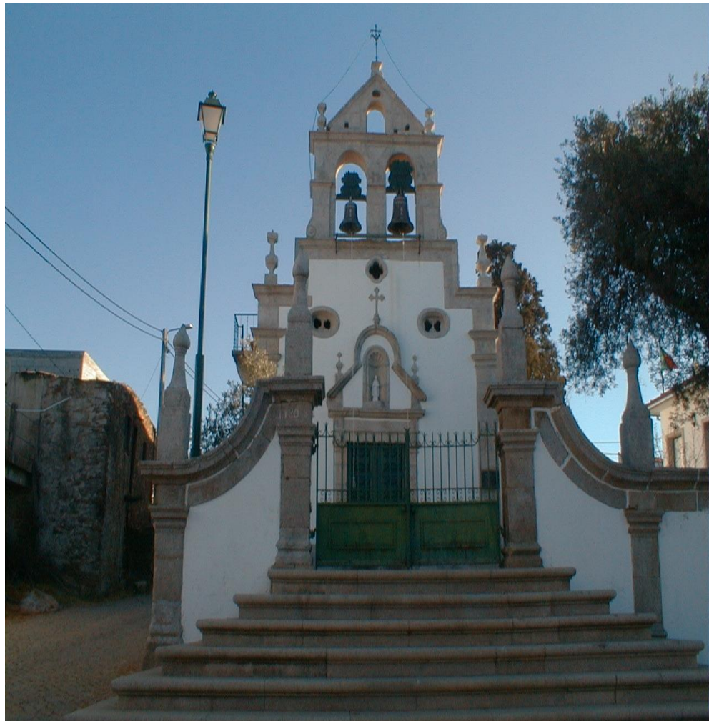
(Igreja Matriz 1808)