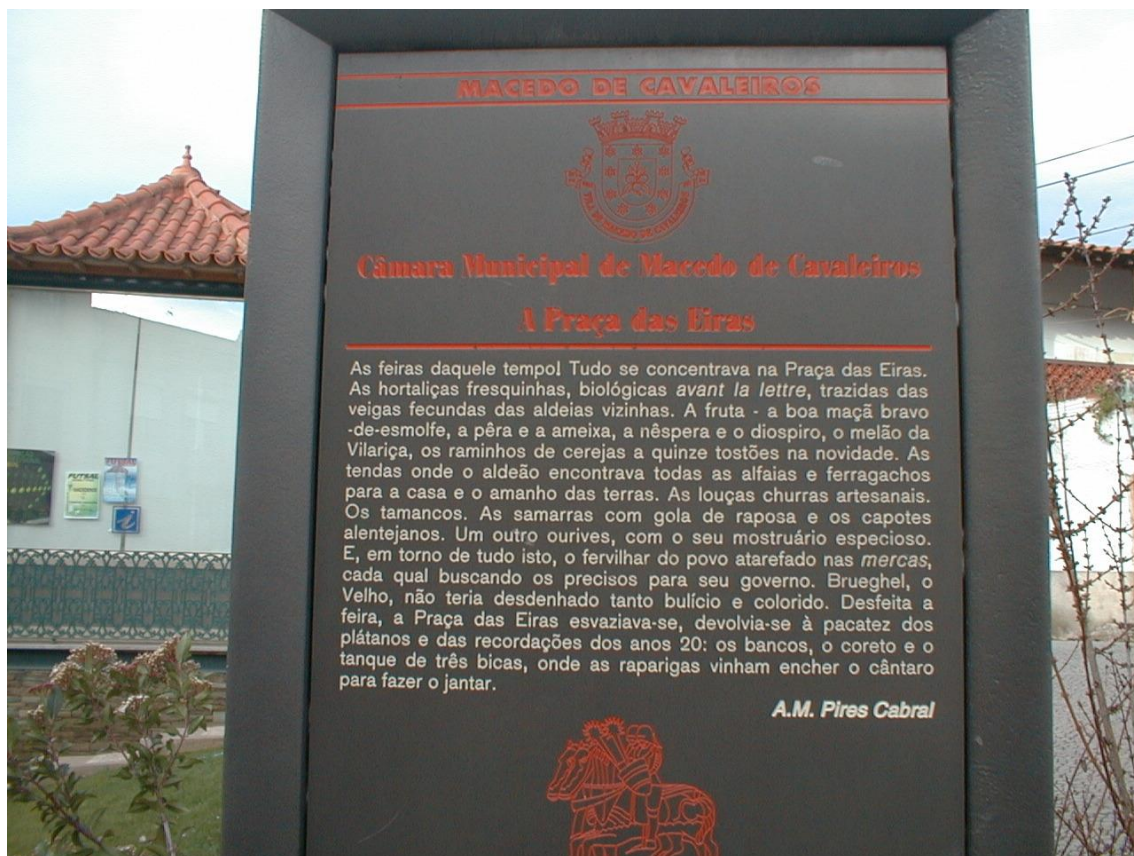
(Sinalética da praça das Eiras, junto ao posto turismo)