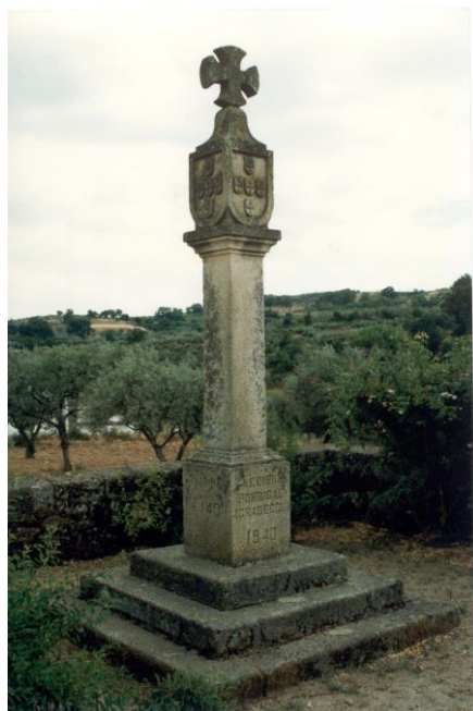
(Cruzeiro Padrão – 1940 - Lamalonga)