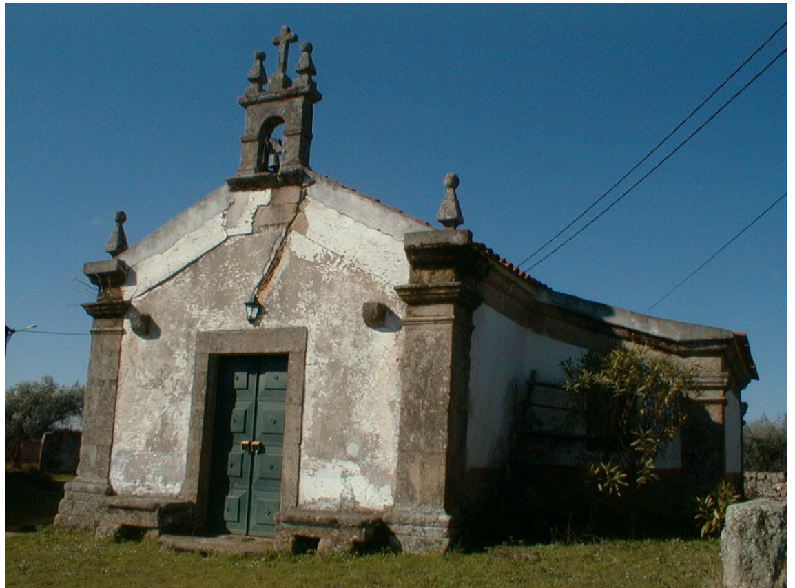
(Capela de S. João)