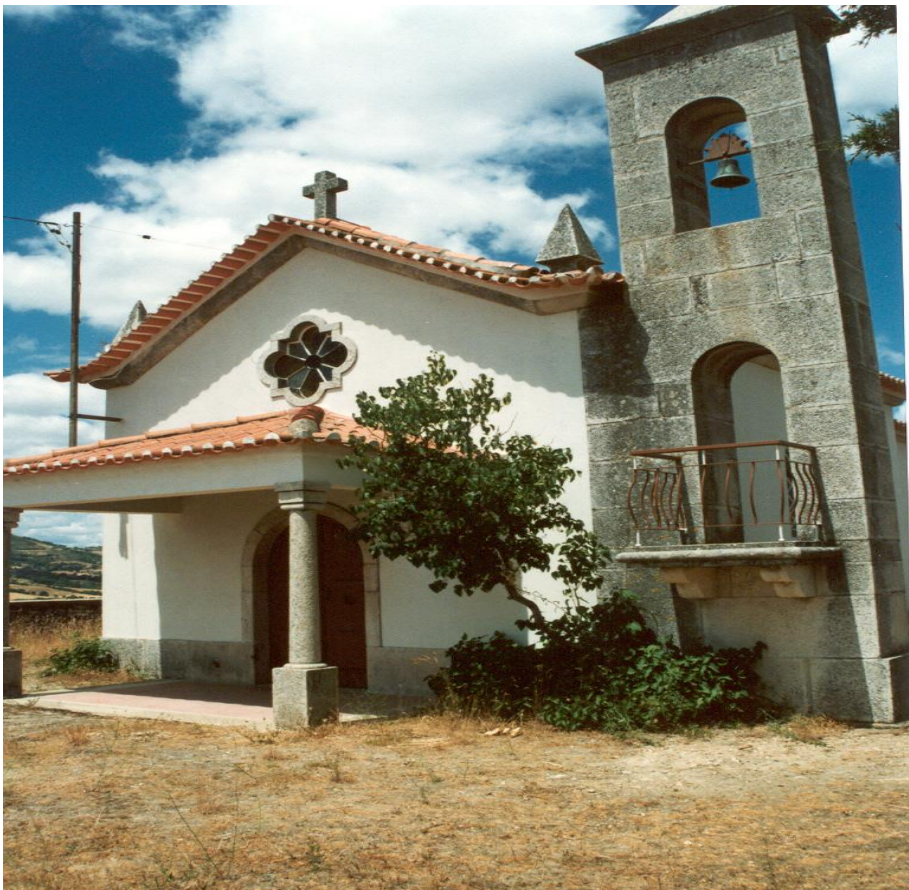
(Capela do Sr do Calvário)