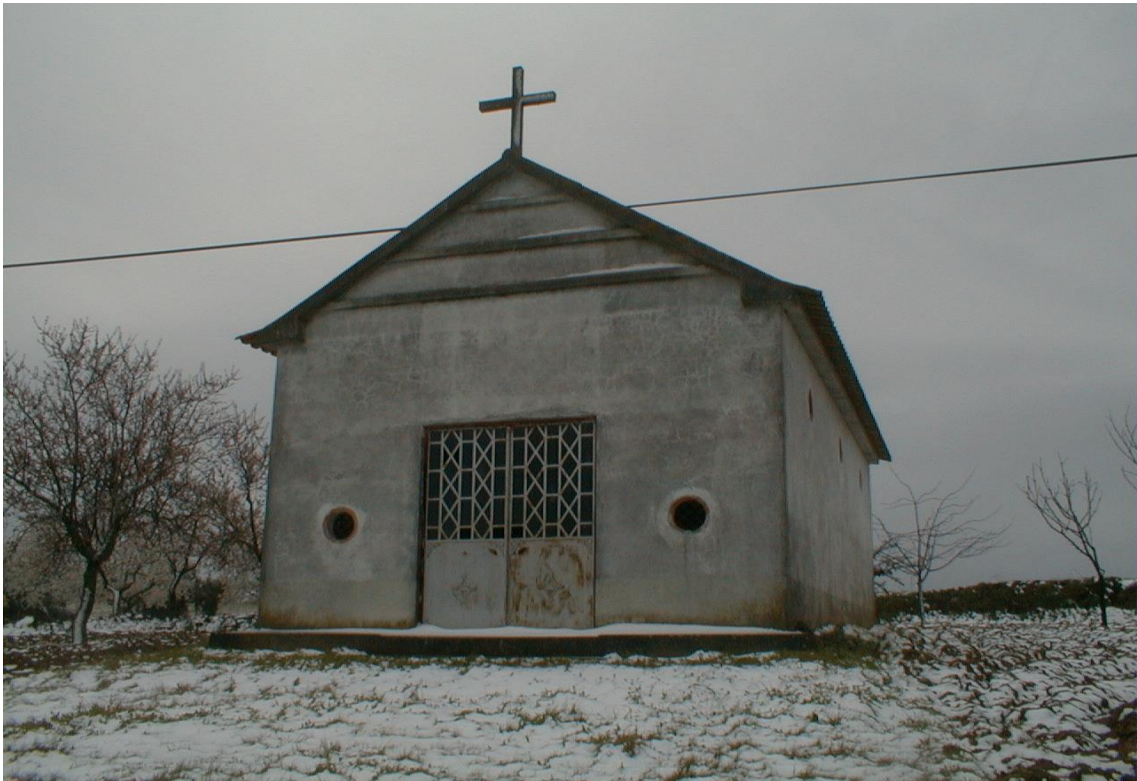
(Capela de NS de Fátima)