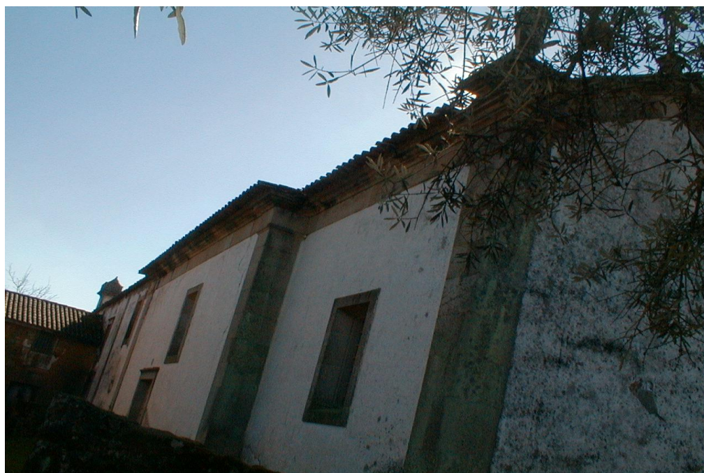
(Antigo Convento das freiras)