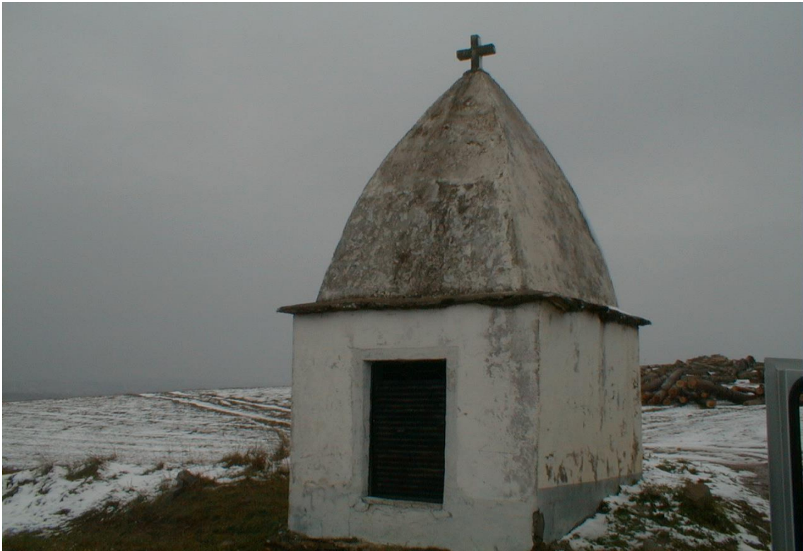
(Capelinha de Santa Marinha)