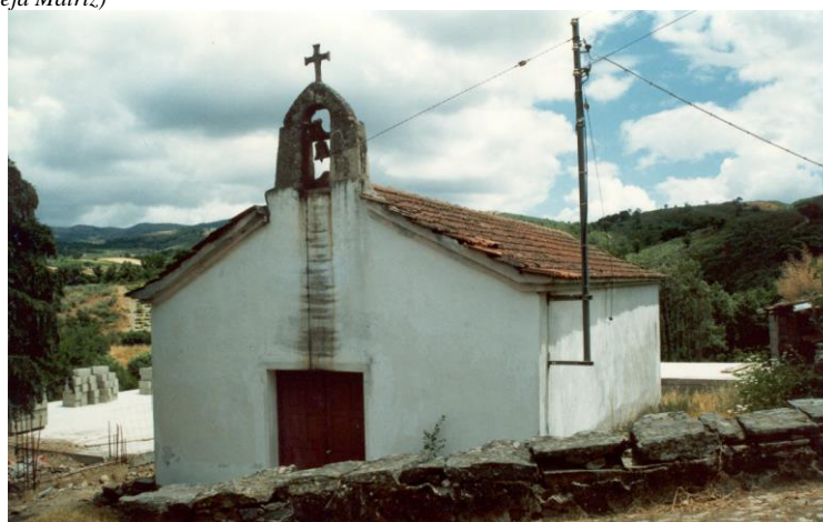
(Capela de Santo Amaro 1758– Comunhas)