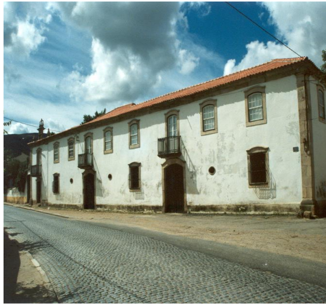
(Solar dos Mirandas com capela e moinho– Grijó)