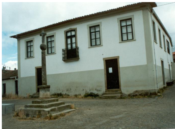
(Cruzeiro 1768 – Lamas)