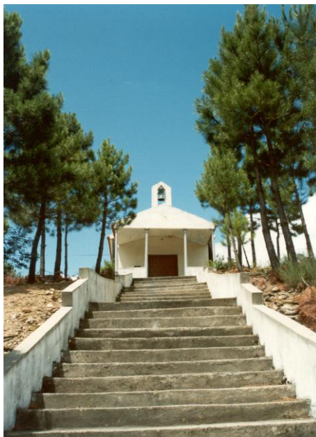
(Capela NS de Fátima – Ferreira)