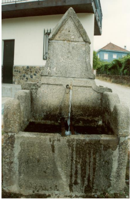
(Fontanário – Lamalonga)