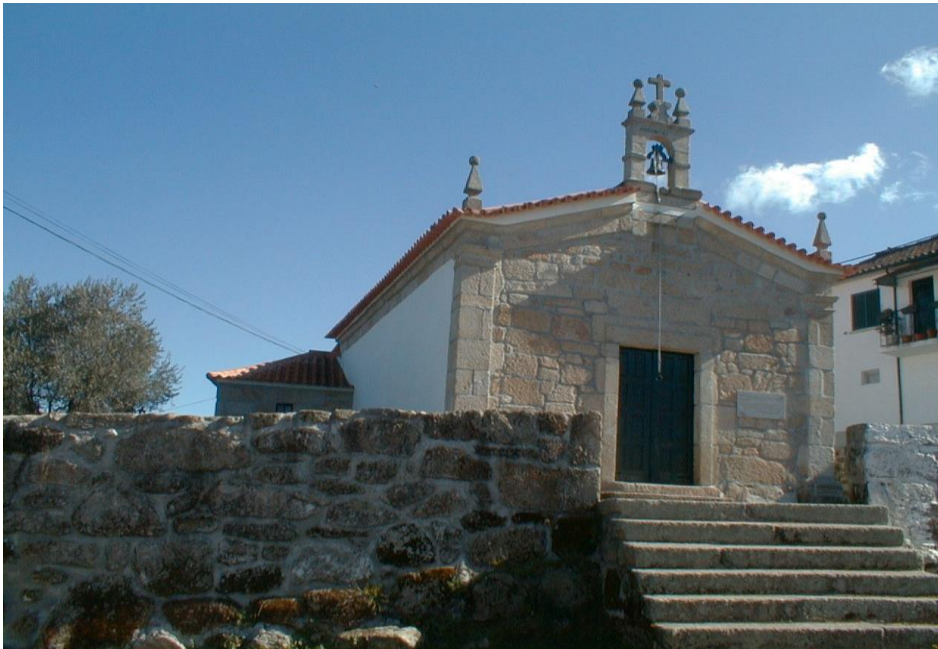
(Igreja Matriz, 1791)