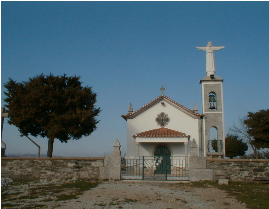
(Capela do Sr Santo Cristo)