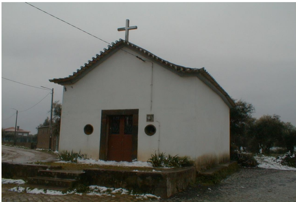
(Capela de Stº Apolinário)