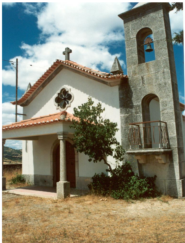
(Capela do Senhor do Calvário – Grijó)