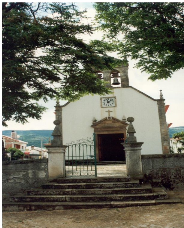
(Frontal da Igreja Matriz de Grijó)