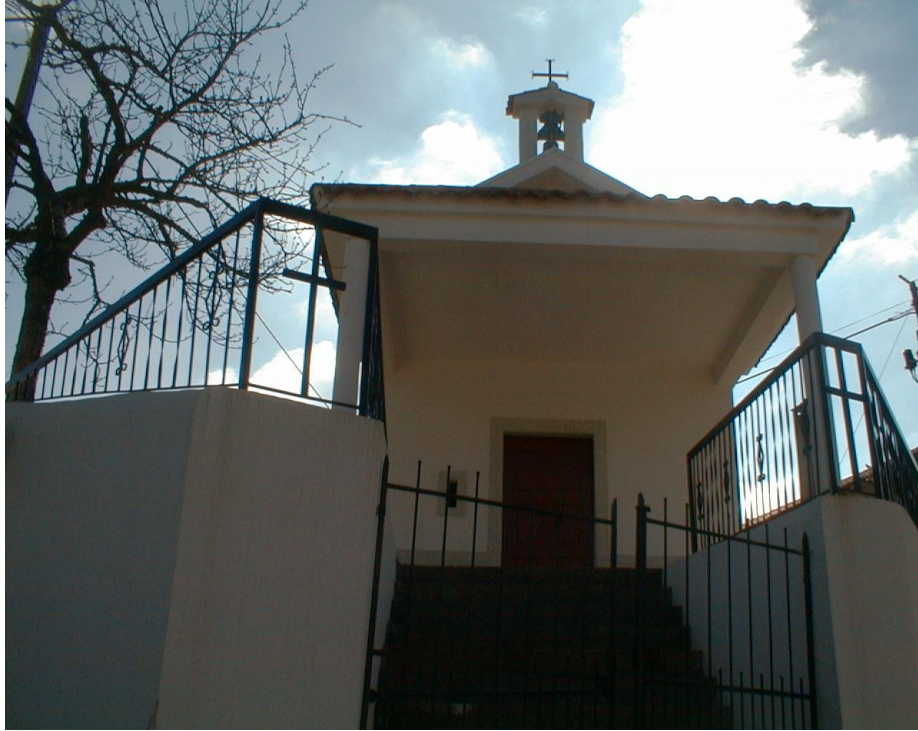
(Capela de S. Sebastião)