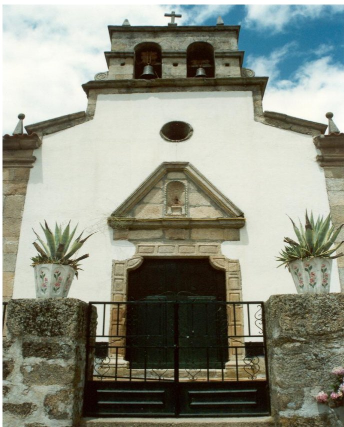
(Igreja Matriz de Fornos de Ledra)