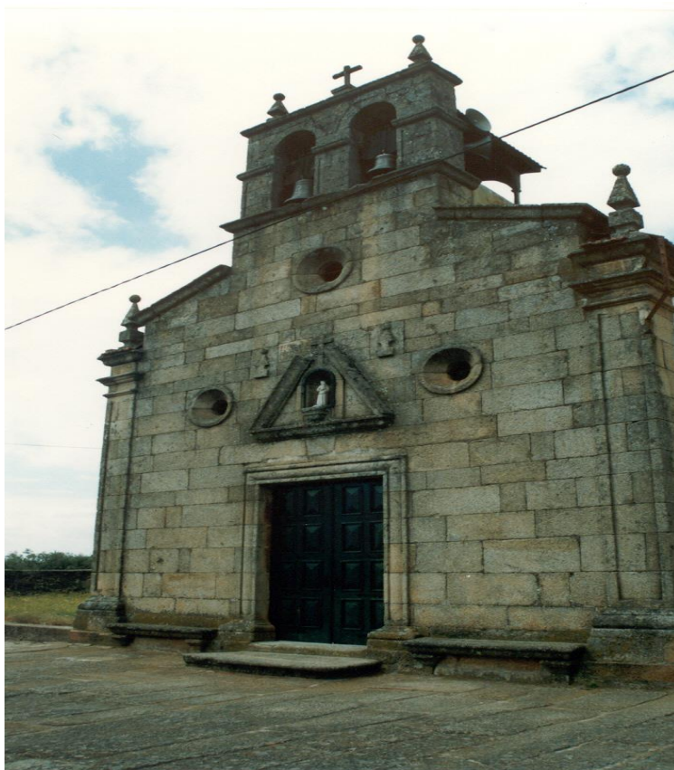
(Igreja Matriz com presépio de Machado de Castro – Lamalonga) Imóvel de Interesse Público por despacho de 4 de Junho de 1999 ( em vias de classificação)