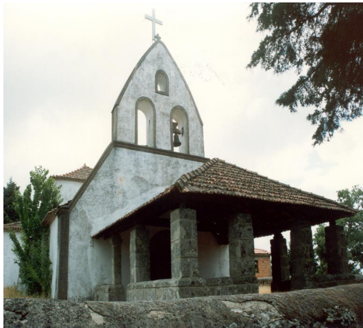
(Capela NS do Campo – Lamas)