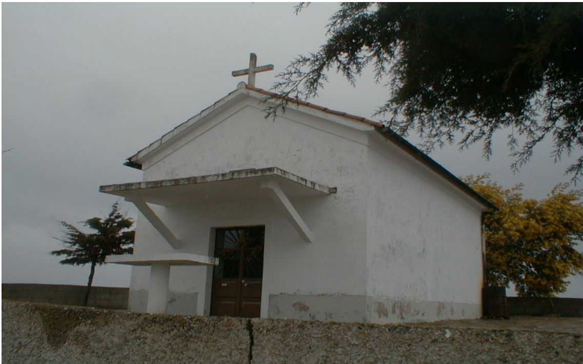
(Capela de Santa Bárbara)